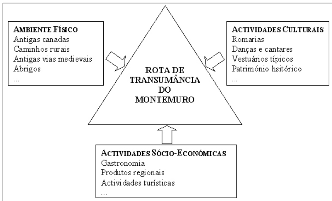
Figura 2. Diagnóstico da Zona Envolvente da Rota da Transumância do Montemuro.

Em primeiro lugar, é necessário conhecer o ambiente físico onde aquela área está integrada, desde as zonas mais baixas da região de Viseu até à Serra do Montemuro. É fundamental o reconhecimento das antigas canadas que percorrem caminhos rurais e antigas vias medievais que atravessam pontes e presenciam cursos de água, abrigos, localidades, campos agrícolas e paisagens naturais. Tudo isto são “peças” que poderão ir ao encontro da satisfação de aspirações de pessoas que procuram actividades de lazer, tais como os passeios pedestres, de bicicleta, de cavalo ou burro, a escalada, a “orientação”, o paintball, o BTT, o cicloturismo, a canoagem e outros desportos do tipo “radical” ou até o todo-o-terreno motorizado e a asa delta.